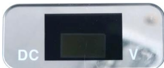
<X-ray 발생 전>