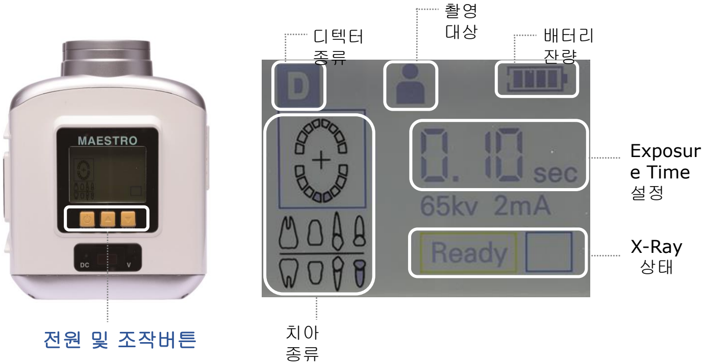
전원 및 조작버튼